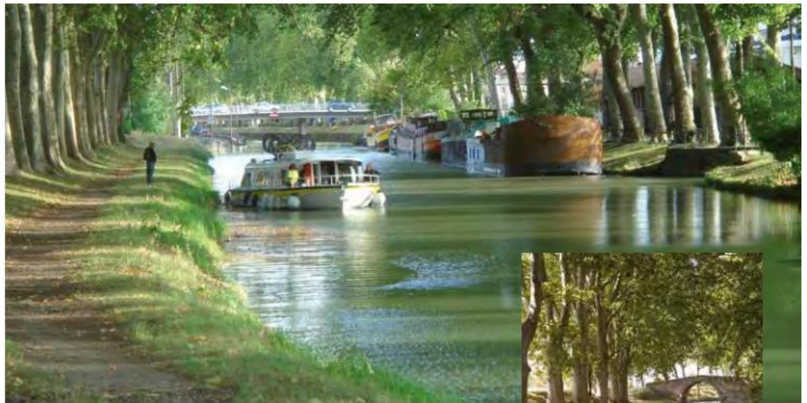
Les platanes du canal du midi